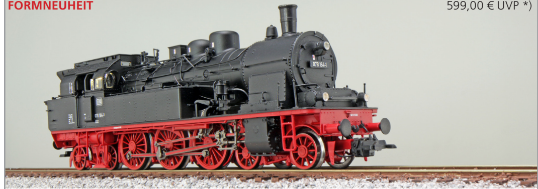
31181 , Dampflokomotive, H0, 078 164 DB, schwarz, Ep. IV, Vorbildzustand um 1971, LokSound, Doppelraucherzeuger, Rangierkupplung, DC/AC