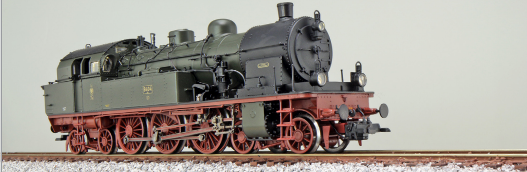
31182 , Dampflokomotive, H0, 8404 Essen KPEV, grün, Ep. I, Vorbildzustand um 1916, LokSound, Doppelraucherzeuger, Rangierkupplung, DC/AC