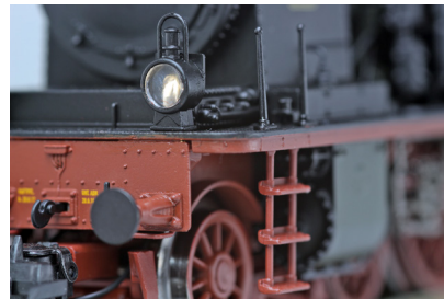
Feinst detaillierte Loklaternen