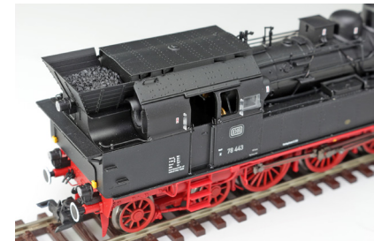
DB-Versionen mit hohem Kohlekasten

*) Unverbindliche Preisempfehlung inkl. 19% deutscher MwSt.