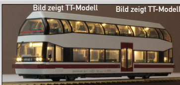
Bild zeigt TT-Modell