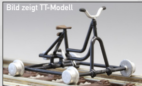
Bild zeigt TT-Modell