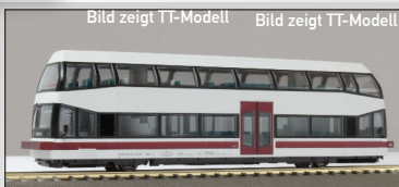
Bild zeigt TT-Modell