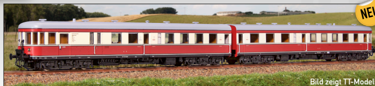
Bild zeigt TT-Modell