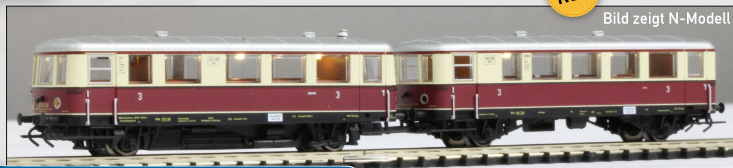
Bild zeigt N-Modell