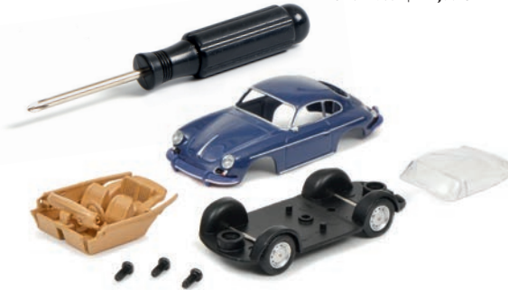
Edition 1:64 Kit „Porsche 356“