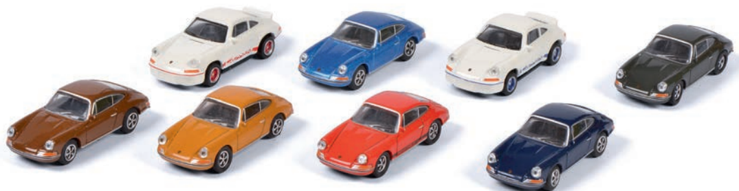
Ladegutpackung/loading package „Porsche 911“ (6 x 911 S, 2 x Carrera 2.7 RS) (ohne Schienen und Autotransporter/without tracks and car transporter)