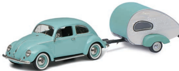
VW Käfer mit ES-Piccolo Wohnwagen/with ES-Piccolo caravan, türkis/turquoise

A great gift idea for both big and small fans of model cars - the new Schuco Edition 1:64 Kits. In just a few steps the accurately reproduced Schuco 1:64 models can be assembled or disassembled using the screwdriver included in the delivery. Appearing this year as the first Schuco 1:64 assembly kits are the Mercedes-Benz Unimog 406, the legendary Porsche 356 classic sports car and the cult Volkswagen T1 Transport Bus.