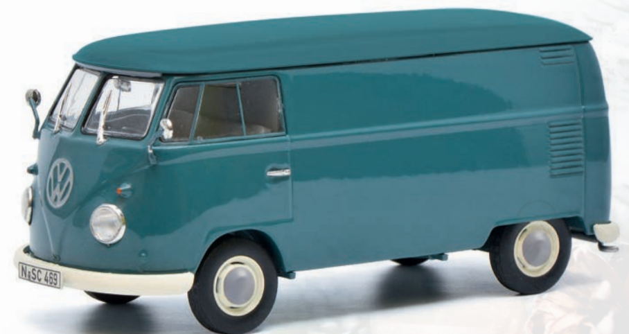
VW T1b Kastenwagen/box van, blau/blue