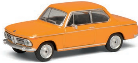
BMW 2002, orange