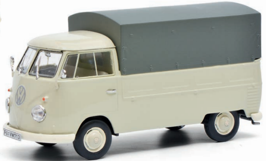
VW T1b Pritschenwagen mit Plane/pick-up with tarpaulin, beige

Since there was a sharp rise in the demand for flexible, multi-use transport vehicles in the early stages of the German economic miracle, Volkswagen started production of the VW Type 2 in 1950. This all-rounder, which was affectionately known as the „VW Bulli“ by its many fans, developed into the outstanding workhorse of the economic upturn in the Germany of the 1950s.