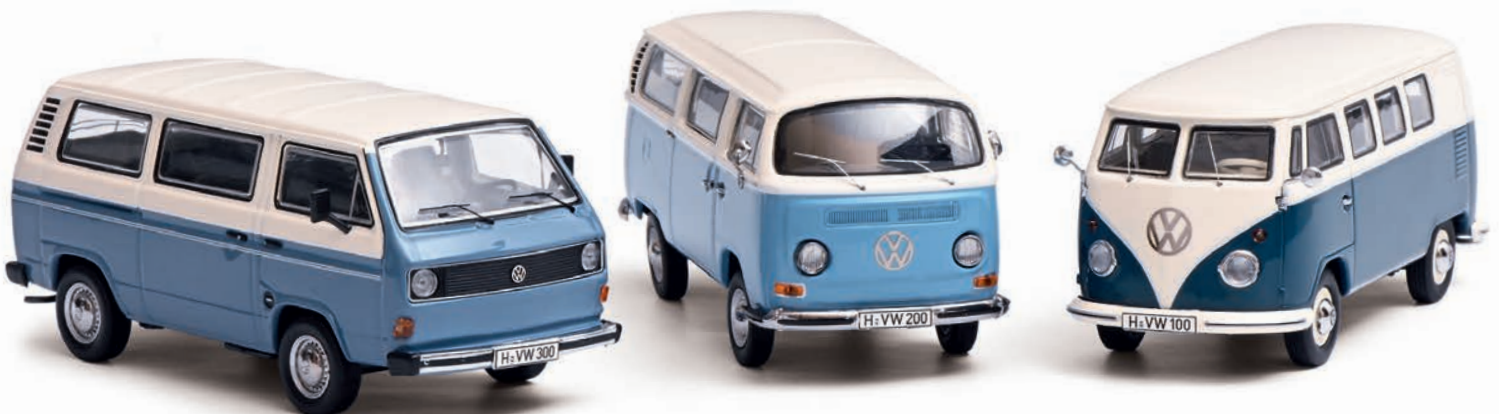
3er-Set „Die Luftgekühlten“ VW T1b, VW T2a, VW T3a, blau-creme/blue creme

For VW fans, these three Transporter series have enjoyed cult status for many years. The VW T1, T2 and T3 all featured an air-cooled 4-cylinder boxer engine. Just 500 copies were made of this limited edition “Air Cooled” set, which showcases the three models in a premium dustproof transparent case. A must-have addition to any VW Transporter collection!