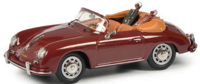
Porsche 356 A Cabrio „Golf“, weinrot/red *