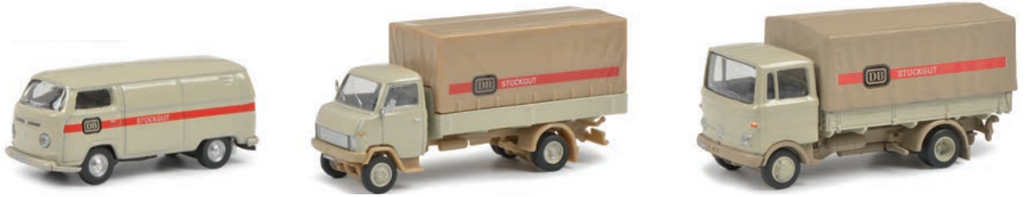
3er-Set „DB-Stückgut“ MB LP608, Hanomag F55, VW T2 Kasten