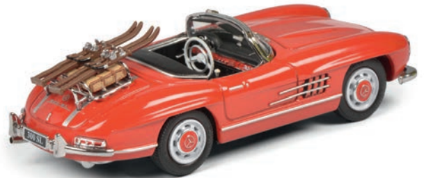
Mercedes-Benz 300 SL Roadster „Skiurlaub“, rot/red