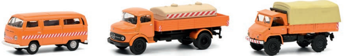
3er-Set Kommunalfahrzeuge VW T2 Bus, MB L322 Tankwagen, Unimog 404