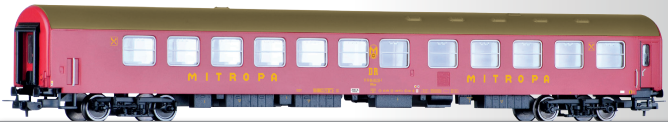
Speisewagen WRme „MITROPA“ der DR Dining coach WRme “MITROPA” of the DR