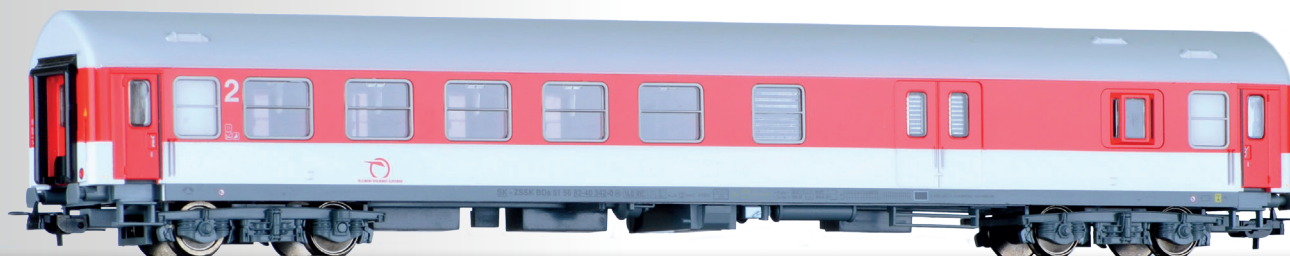
Reisezugwagen 2. Klasse mit Gepäckabteil, Typ Y/B 70, der ZSSK 2nd class passenger coach with baggage compartment, type Y/B 70, of the ZSSK