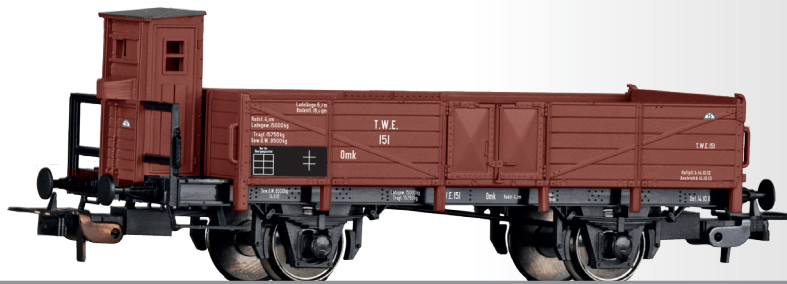
Offener Güterwagen Omk der Teutoburger Wald Eisenbahn (TWE) Open car Omk of the Teutoburger Wald Eisenbahn (TWE)