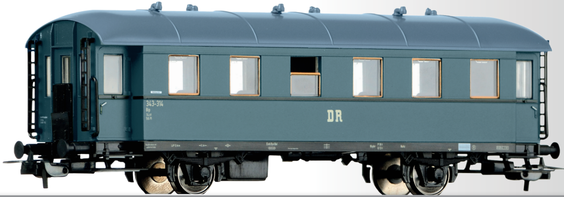
Personenwagen 2. Klasse Bip der DR 2nd class passenger coach Bip of the DR