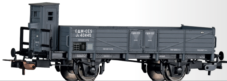
Offener Güterwagen JG der CES Open car JG of the CES • CES - Serbokroatische Staatsbahnen