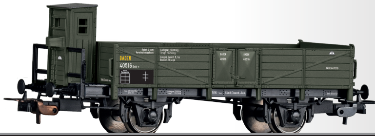
Offener Güterwagen Omk der Süddeutschen Eisenbahn-Gesellschaft Open car Omk of the Süddeutschen Eisenbahn-Gesellschaft