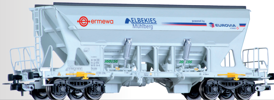
Selbstentladewagen Faccons der Ermewa / EUROVIA Hopper car Faccons of the Ermewa / EUROVIA