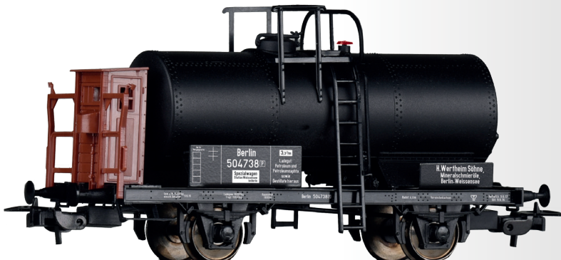
Kesselwagen „H. Wertheim Söhne“, eingestellt bei der K.P.E.V. Tank car “H. Wertheim Söhne” of the K.P.E.V.