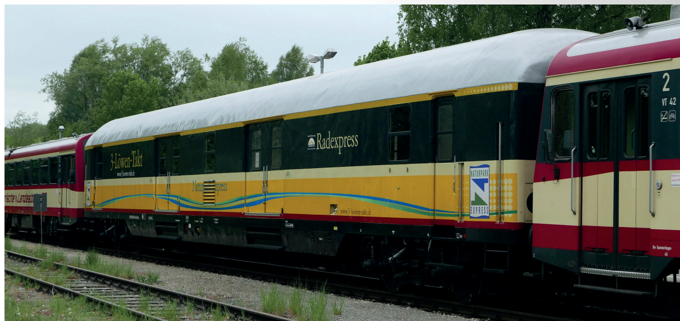
Gepäckwagen, Fahrradwagen, „Naturpark-Express“ der Hohenzollerischen Landesbahn

Baggage car "Naturpark-Express" of the Hohenzollerischen Landesbahn