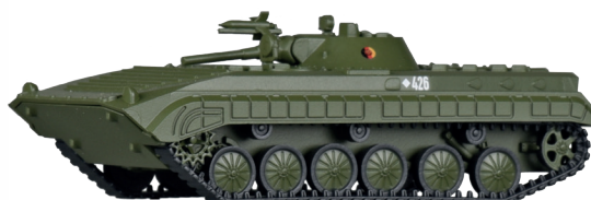
Schützenpanzer BMP-1 „NVA“ Tank type BMP-1 „NVA“