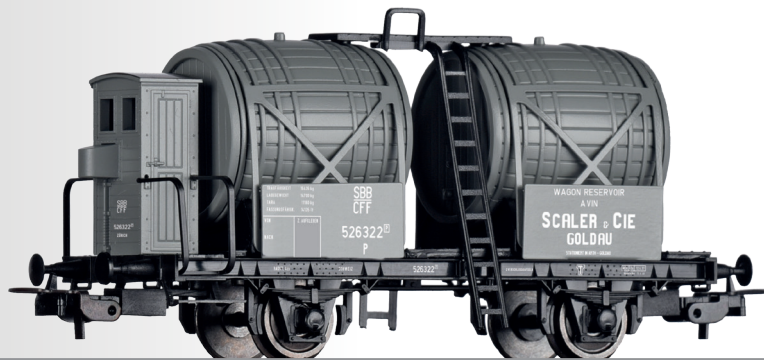
Weinfasswagen „Scaler & Cie.“, eingestellt bei den SBB Wine barrel car “Scaler & Cie.” of the SBB