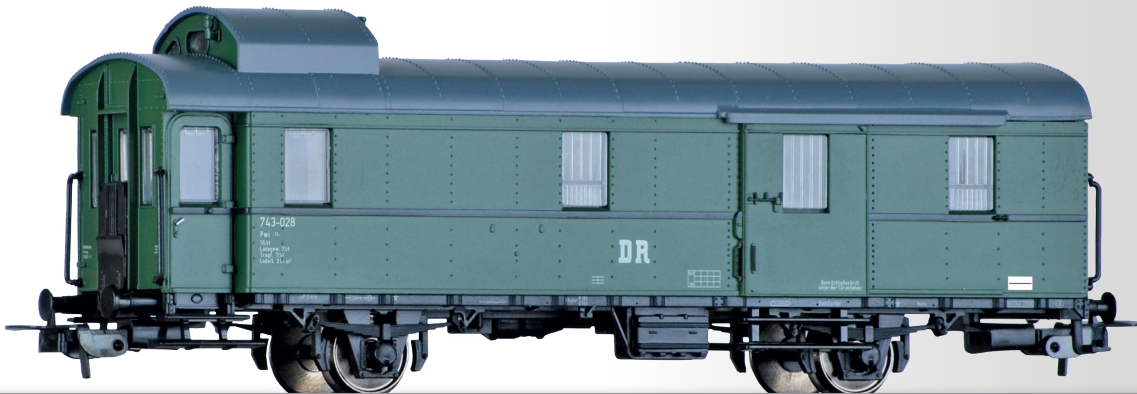
Packwagen Pw der DR Baggage car Pw of the DR