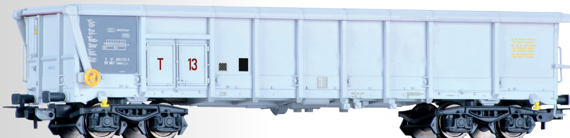
Rolldachwagen Tamns der SNCF Sliding roof car Tamns of the SNCF