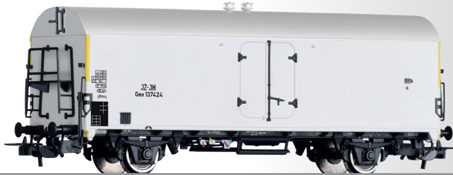
Kühlwagen Gmv der JZ Refrigerator car Gmv of the JZ