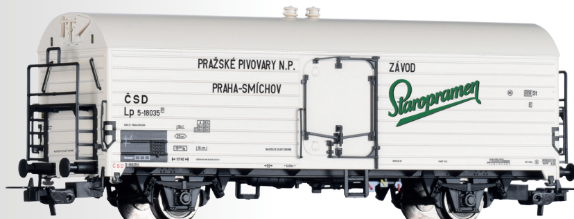
Kühlwagen Lp „Staropramen“, eingestellt bei der ČSD Refrigerator car Lp “Staropramen” of the ČSD