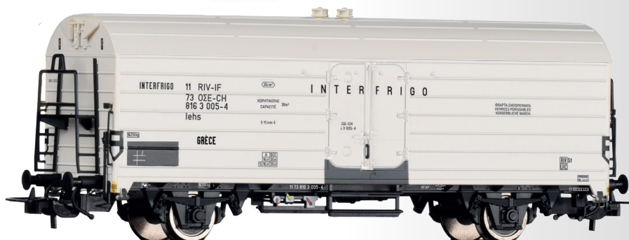
Kühlwagen lehs „Interfrigo“ der OSE Refrigerator car lehs "Interfrigo" of the OSE