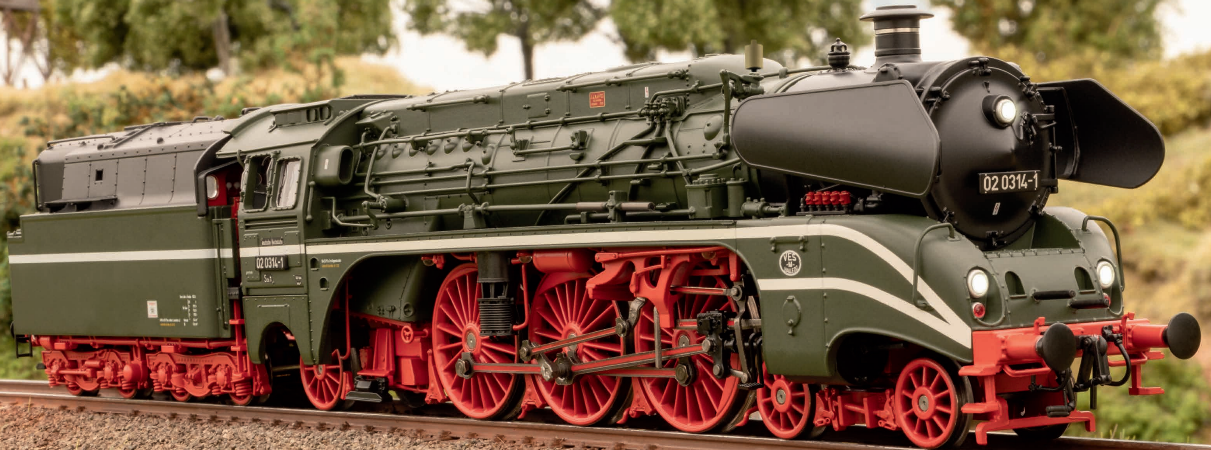
Foto zeigt erstes Handmuster