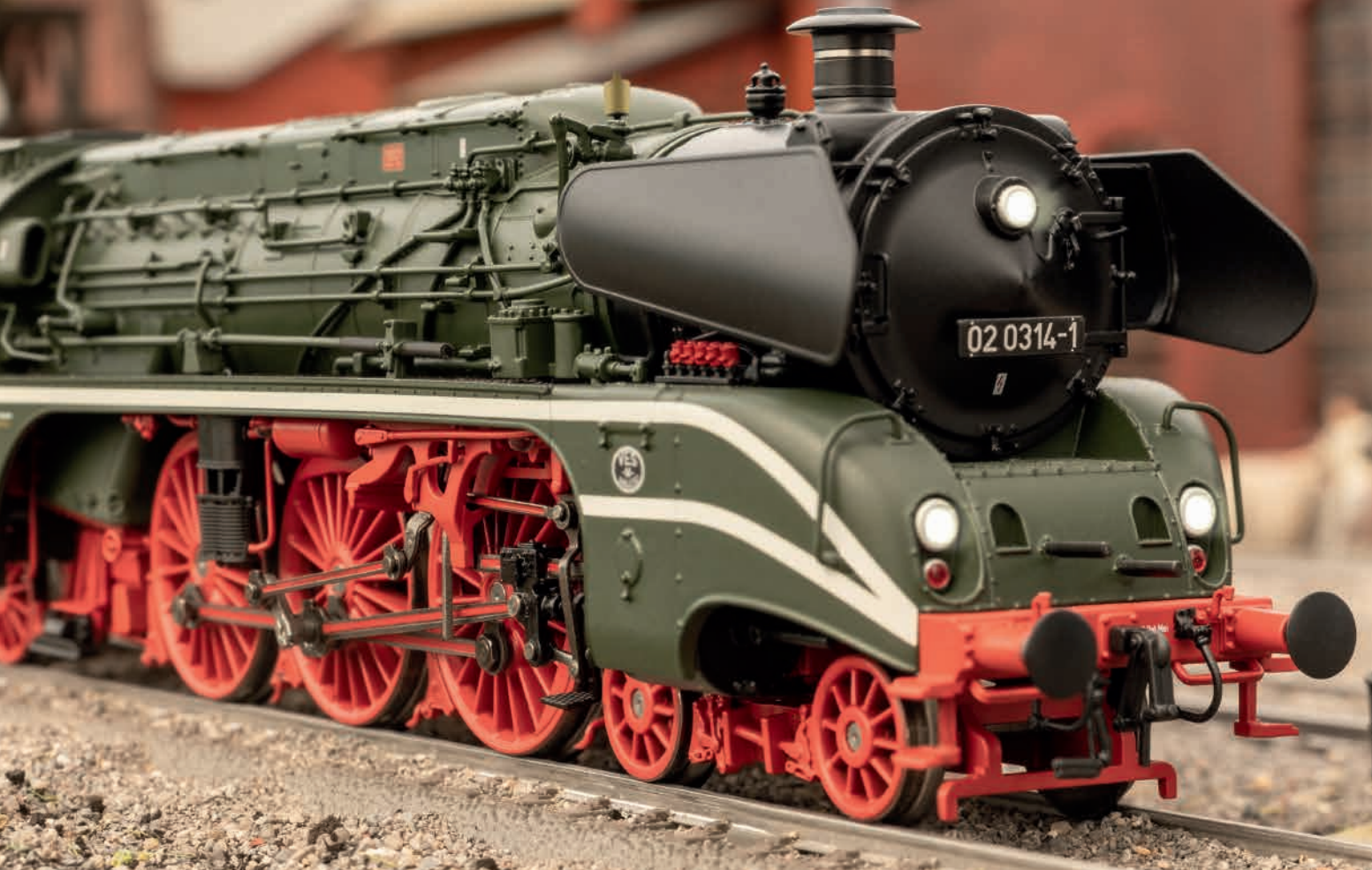
Foto zeigt erstes Handmuster The photo shows the first hand sample