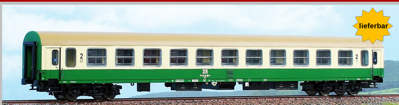
AC52471 Personenwagen Bauart Bomz (Halberstadt) 2.Klasse, DR, Epoche IV / V UVP - 74,50 € 2. Wagennummer