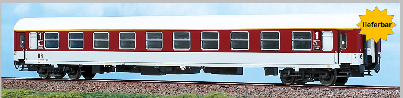
AC52460 Personenwagen „Komfort“ Bauart Am (Halberstadt) 1.Kl. DR, Epoche IV UVP - 75,50 €