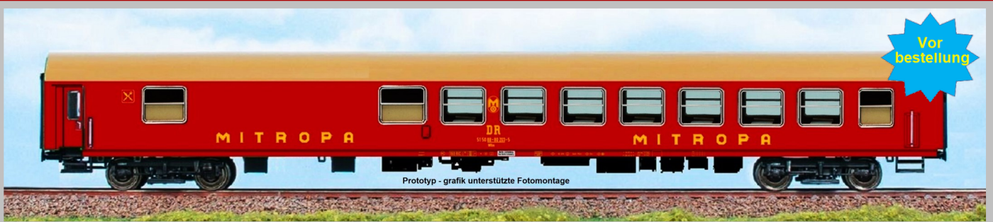
AC 52130 Speisewagen der Bauart Bautzen „MITROPA“ der DR, Epoche IV UVP - Preis bei Erscheinen