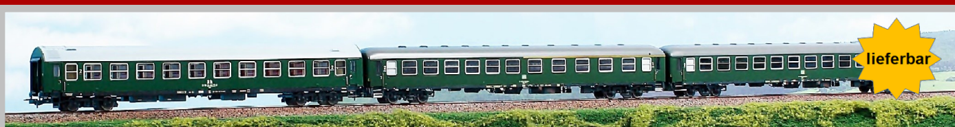
AC55244 „Italia-Express“ Rom - Frankfurt - Berlin - Amsterdam, DR/DB, Ep. IV bestehend aus DR-Schlafwagen, DB Liegewagen, DB-Personenwagen 1./2. Klasse UVP - 242,20 €