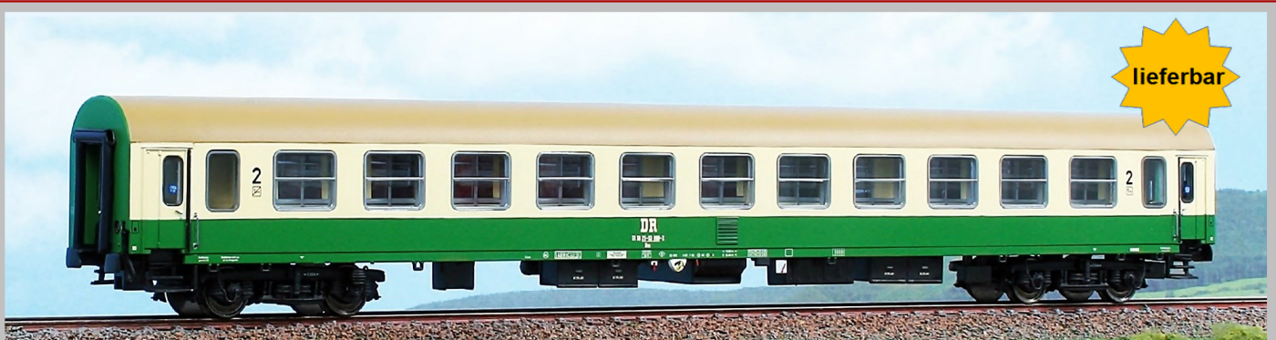
AC52471 Personenwagen Bauart Bomz (Halberstadt) 2.Klasse, DR, Epoche IV / V UVP - 74,50 €