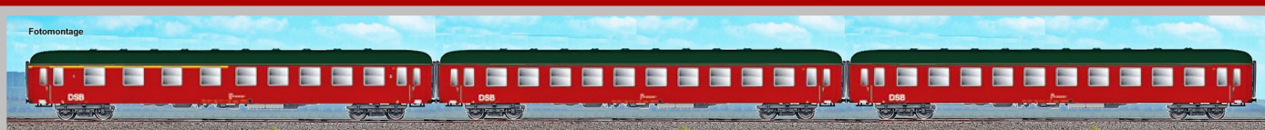
AC55217 Ex 322/323 „Neptun“ der DR/DSB, Epoche IV (1 x 1./2. Klasse und 2 x 2. Klasse der DSB) „Berlin-Stadtbahn - Warnemünde - Kopenhagen“ UVP - Preis bei Erscheinen