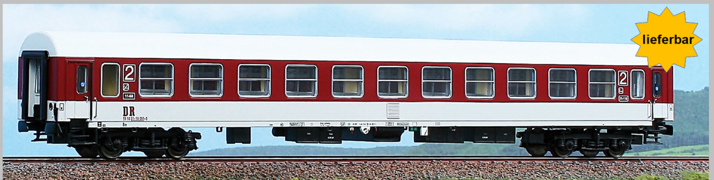
AC52470 Personenwagen „Komfort“ Bauart Bm (Halberstadt) 2.Kl. DR, Epoche IV UVP - 75,50 €