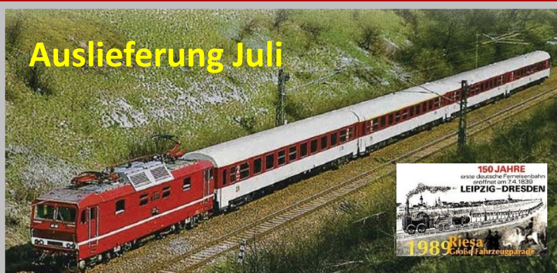
AC55271 DR - Zug der Zukunft, Epoche IV bestehend aus 4 Komfortwagen 1 x 1.Klasse, 3 x 2.Klasse Betriebszustand April 1989 als Sonderzug 93330 mit 230 001-0 UVP - Preis bei Erscheinen