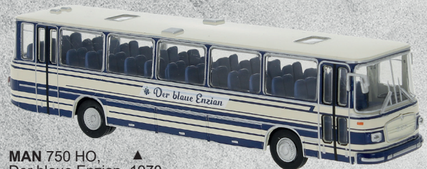
MAN 750 HO, ▶ Der blaue Enzian, 1970 Nr. v 59259 34.95