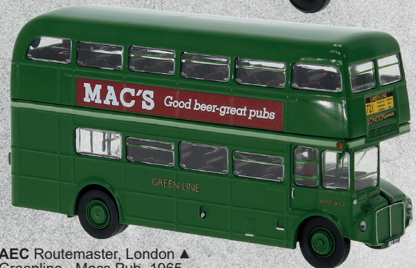
AEC Routemaster, London ▶ Greenline - Macs Pub, 1965 Nr. v 61111 34.95