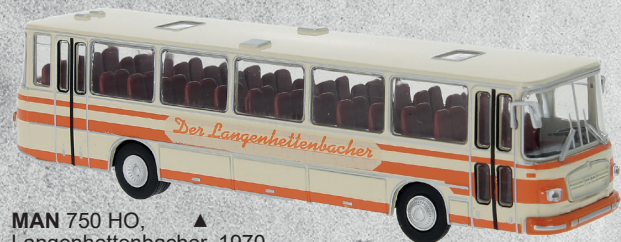
MAN 750 HO, ▶ Langenhettenbacher, 1970 Nr. v 59257 34.95