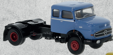
◀ Mercedes LS 1620, 1970 Nr. v 81121 13.95