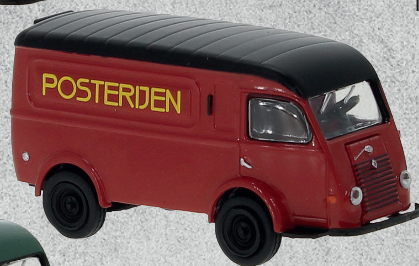
Renault Goelette, Posterijen (NL), 1950 Nr. v 14657 16.95 ▶