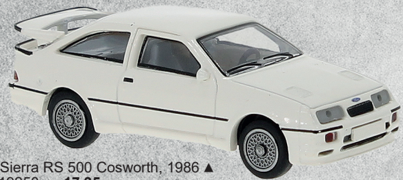
Ford Sierra RS 500 Cosworth, 1986 ▲ Nr. n 19250 17.95