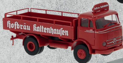
◀ Mercedes LP 328 (A), Hofbräu Kaltenhausen, 1960 Nr. v 48043 17.95