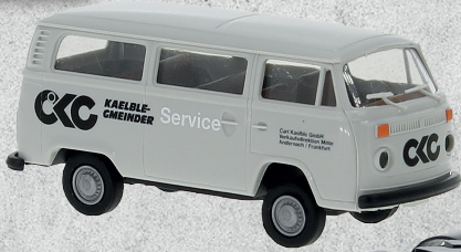
◀ VW T2 Kombi, Kaelble-Gmeinder-Service 1973 Nr. v 33152 13.95