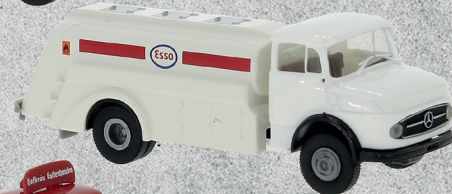
Mercedes L 322, Esso 1960 Nr. v 47037 24.95 ▶