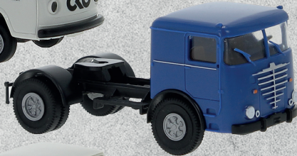
Mercedes LS 1620, 1970 Nr. v 81120 13.95 ▶