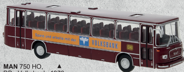
MAN 750 HO, ▶ DB - Volksbank, 1970 Nr. v 59254 34.95