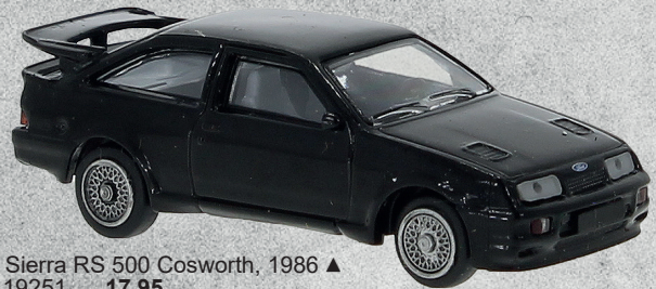
Ford Sierra RS 500 Cosworth, 1986 ▲ Nr. n 19251 17.95