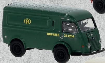
◀ Renault Goelette, Bahn Belgien (B), 1950 Nr. v 14656 16.95