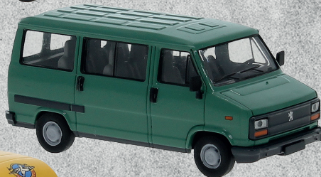
Peugeot J5 Bus, 1982 Nr. 34904 17.95 ▶