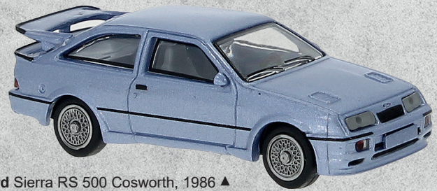
Ford Sierra RS 500 Cosworth, 1986 ▲ Nr. n 19252 17.95