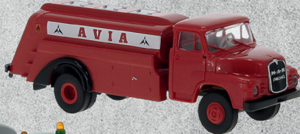
MAN 635, Avia, 1955 Nr. v 45054 24.95 ▶