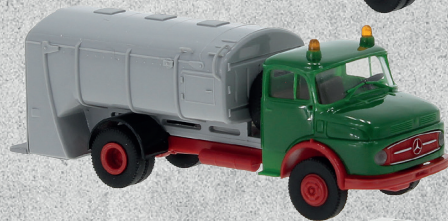
◀ Mercedes L 322 Müllwagen, 1960 Nr. v 47041 14.95