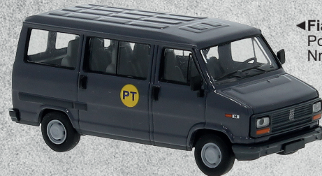
◀ Fiat Ducato Bus, Post (IT), 1982 Nr. n 34901 18.95