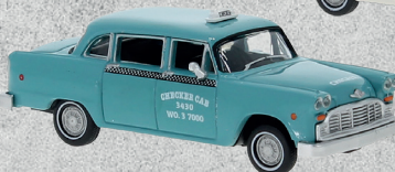
◀ Checker Cab, Detroit von Drummer Nr. v 58937 14.95