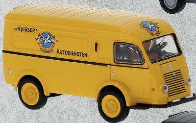
◀ Renault Goelette, Visser Autodienst, 1950 Nr. v 14658 16.95