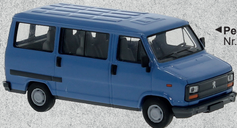
◀ Peugeot J5 Bus, 1982 Nr. n 34905 17.95