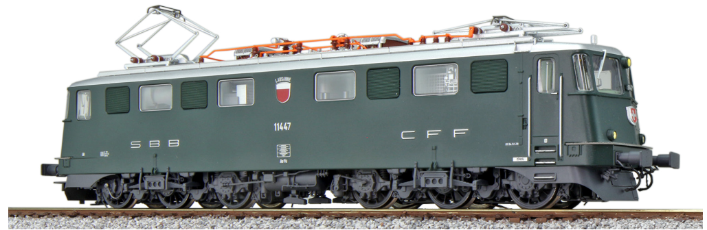
31536 , E-Lok, H0, AE6/6, 11447 Lausanne, grün, Ep. IV, DC/AC