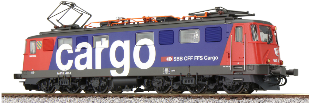
31532 , E-Lok, H0, AE6/6, 610 487-1 Langenthal, rot/blau, Ep. V, DC/AC