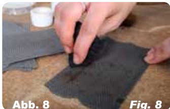
Abb. 8 Fig. 8 Überschüssige Farbe abtupfen. Ergebnis ist ein vorbildgerechtes Kopfsteinpflaster.

To bring out gap apply powder colour with a brush.