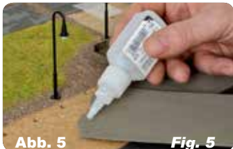
Abb. 5 Fig. 5 Straßenplatten auf der Rückseite mit Kleber einstreichen.

Paste glue on the back of the street plates.