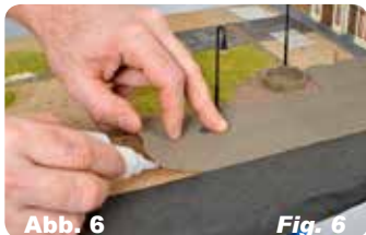
Abb. 6 Fig. 6 Untergrund mit Kleber einstreichen und Straßenplatte leicht andrücken.

Paste glue on the back of the street plates.