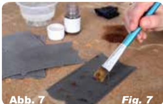
Abb. 7 Fig. 7 Heben Sie die Fugen hervor, indem Sie Farbpulver mit einem Pinsel auftragen.

To bring out gap apply powder colour with a brush.