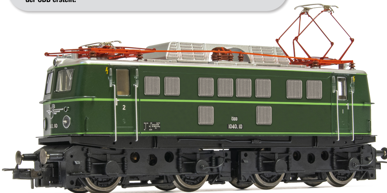
Fotomontage / Fotomontaje / Photomontage / Fotomontaggio