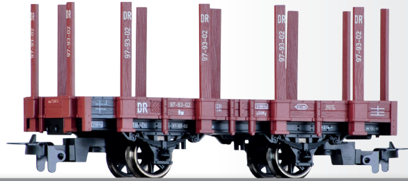
Rungenwagen Rw der DR Stake car Rw of the DR