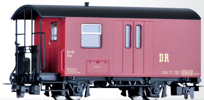
Packwagen KDaai der DR Baggage car KDaai of the DR