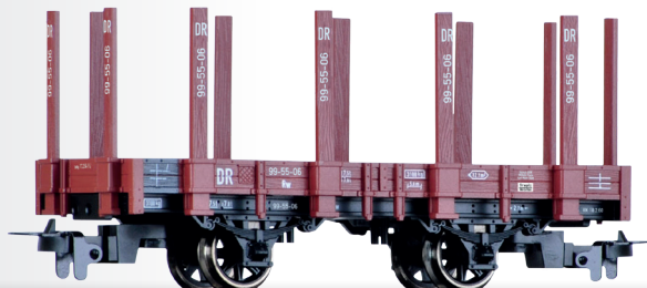
Rungenwagen Rw der DR Stake car Rw of the DR